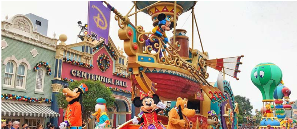
**อิสระอาหารค่ำ ตามอัธยาศัย**

ขบวนพาเหรด ไฟลท์ส ออฟ แฟนตาซี จะจัดแสดงในเวลา 13.30 น. ของทุกวัน โดยสามารถชมขบวนพาเหรดได้ที่เมนสตรีท ยูเอสเอ (ขึ้นอยู่กับสภาพอากาศ ณ วันนั้นๆ) ชมและเชียร์ตัวละครดิสนีย์ ที่ร่วมขบวนมากมายไม่ว่าจะเป็นตัวการ์ตูนดัง อาทิ Mickey mouse, Minnie mouse, Winnie and the Pooh ตามด้วยเจ้าหญิงแสนสวยจากนิทานหลากหลายเรื่อง อาทิ Snow White, Rapunzel, Cinderella ฯลฯ หรือตัวละครจากภาพยนตร์ดัง อาทิ The Jungle Book, The Lion King, Toy Story ฯลฯ